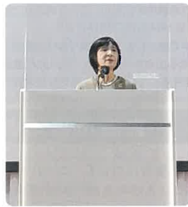
▲発表する細井部長