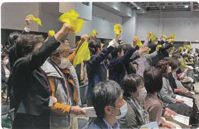
▲黄色いハンカチを使った応援