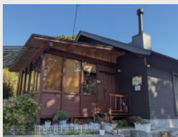
まにわ創業塾 2020 受講者