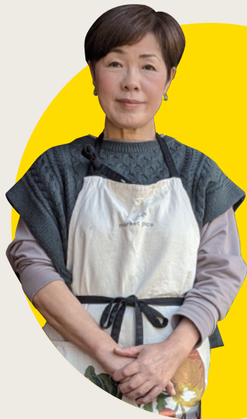
まにわ創業塾 2020 受講者