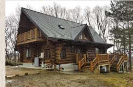
当社施工のログハウス