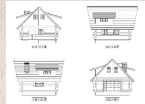
ハンドカットのログハウスキット施工完成例2