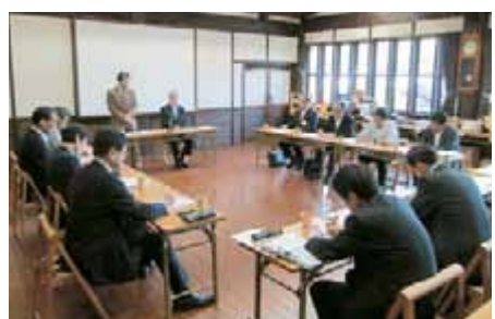
連携と人材育成の 重要性について審議された

産業観光部から9名、 真庭商工会からは、 正副会長・両部会長 及び職員を含む8名 が参加しました。 今年のテーマは、 「雇用の拡大」で 昨年同様に「雇用の 拡大」で意見交換を行 いました。 意見交換の内容をまと めると、連携と人材育 成の重要性が挙げら れました。