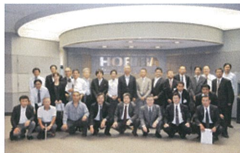
▲株式会社 堀場製作所にて

●株式会社堀場製作所 国際的な計測機器メーカーであり、排気ガス測定装置は世界シェア8割を占める会社で、創業者で最高顧問の堀場雅夫氏より、生まれ育った京都を愛し大切に思い、「おもしろおかしく」を社是として、全社一丸となりベンチャービジネスのモデルともいえる企