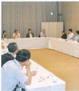
▲真庭リバーサイドホテルにて情報交換

夢や希望が持てる企業づくりができるよう今後も情報交換の機会を持つ方向で協議していくことになりました。