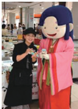
※新庄村イメージキャラクター ひめっ子

も作って下さっている商工会の方には大変感謝しております。 今後も、講習会等積極的に参加し、しっかりと色々な事を学ばせていただきたいと思いま