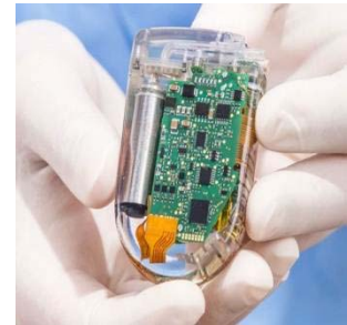
マイクロモーター内蔵機器

医療カテーテル・内視鏡等の精度を向上させるため、マイクロモーターに使用される部品を世界最小クラスまで小型化するための試作開発を行います。